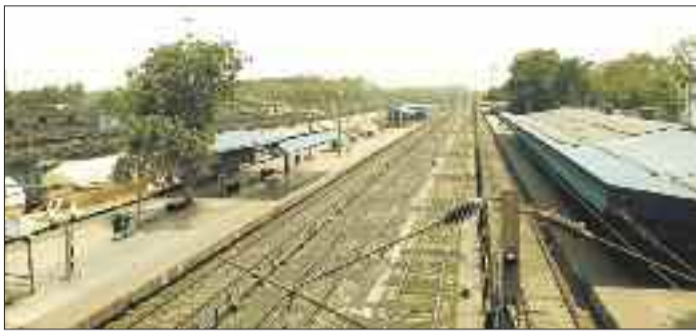
कोरबा का रेलवे स्टेशन जहां अधूरा पड़ा है निर्माण कार्य।

क्रमांक 2 यात्रियों को अभी भी धूप में गाड़ियों का इंतजार करना पड़ता है। प्लेटफार्म में सभी जगह शेड का निर्माण नहीं होने से यात्रियों के समक्ष यह मजबूरी है। रेलवे स्टेशन प्लेटफार्म क्रमांक 1 में जहां शेड का विस्तर किया गया है। वहीं दूसरी ओर प्लेटफार्म क्रमांक 2 के दोनों हिस्सों में शेड निर्माण की दरकार बनी हुई है। जितनी जगह शेड बना है गर्मी और बरसात में यात्रियों को खड़े होने की जगह भी कम पड़ जाती है, जबकि यात्रियों के लिए प्लेटफार्म में शेड का होना आवश्यक सुविधा में शामिल है। किंतु रेलवे को करोड़ों का राजस्व देने वाले कोरबा रेलवे स्टेशन को कई सुविधाओं का इंतजार है। जिनमें सर्वसुविधायुक्त वेटिंग हॉल के साथ शेड का निर्माण शामिल है। प्लेटफार्म