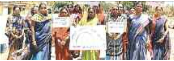
जागरूकता रैली में शामिल महिलाएं।