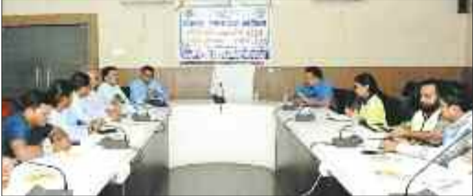
बैठक में उपस्थित अधिकारी कर्मचारी।