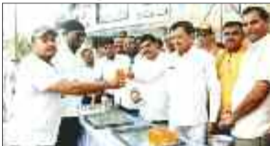
शरबत वितरण करते उद्योग मंत्री व अन्य।